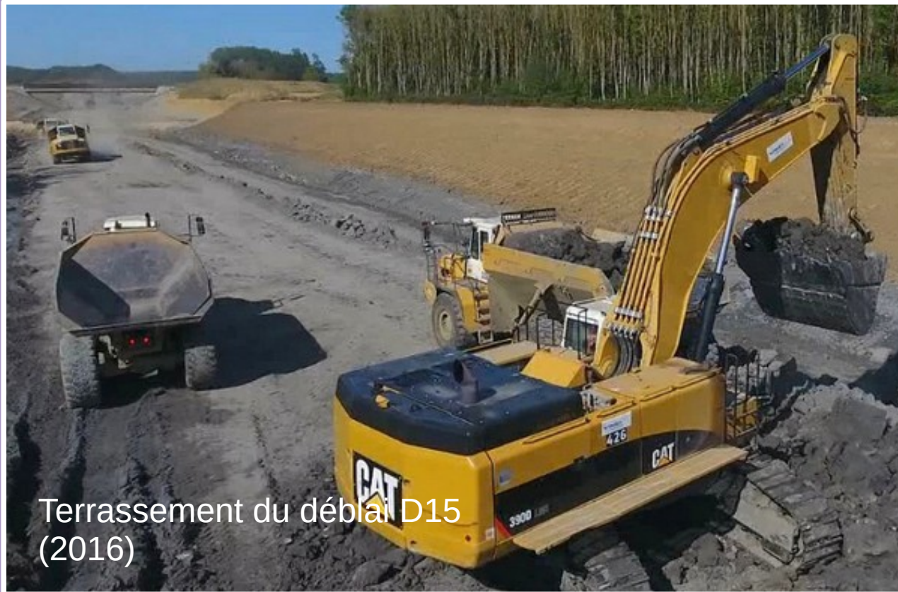
Terrassement du déblai D15 (2016)