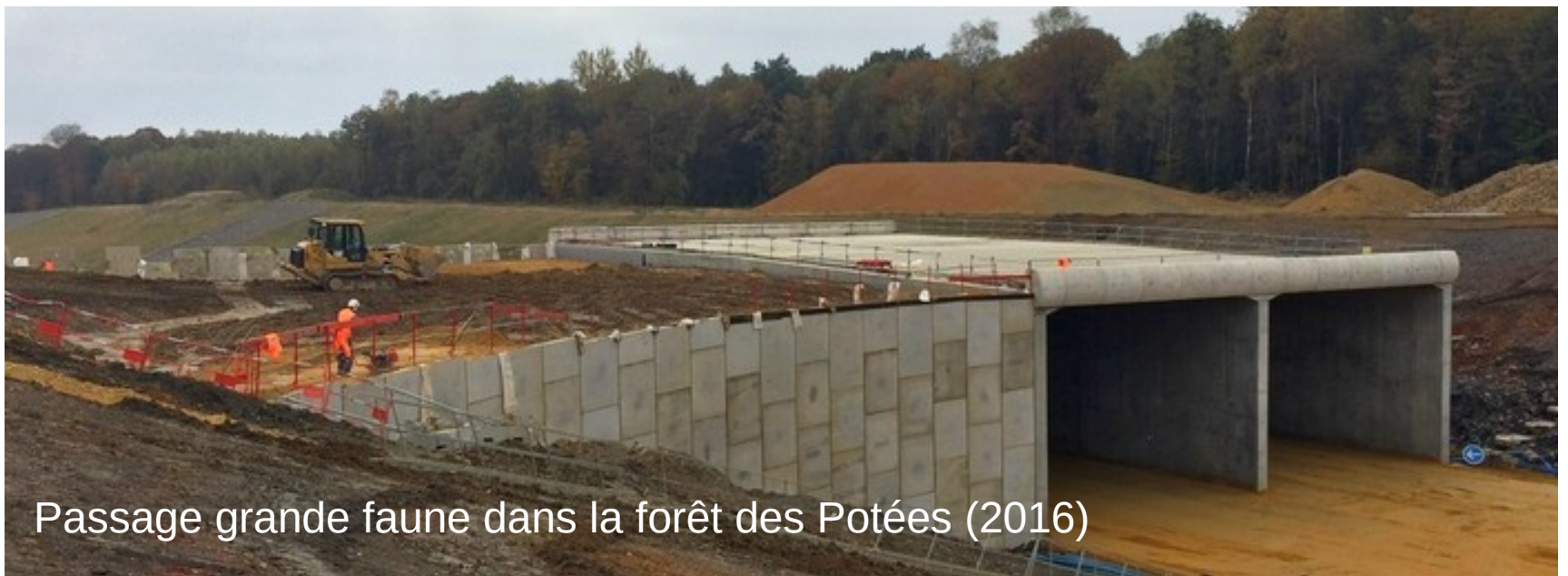
Passage grande faune dans la forêt des Potées (2016)