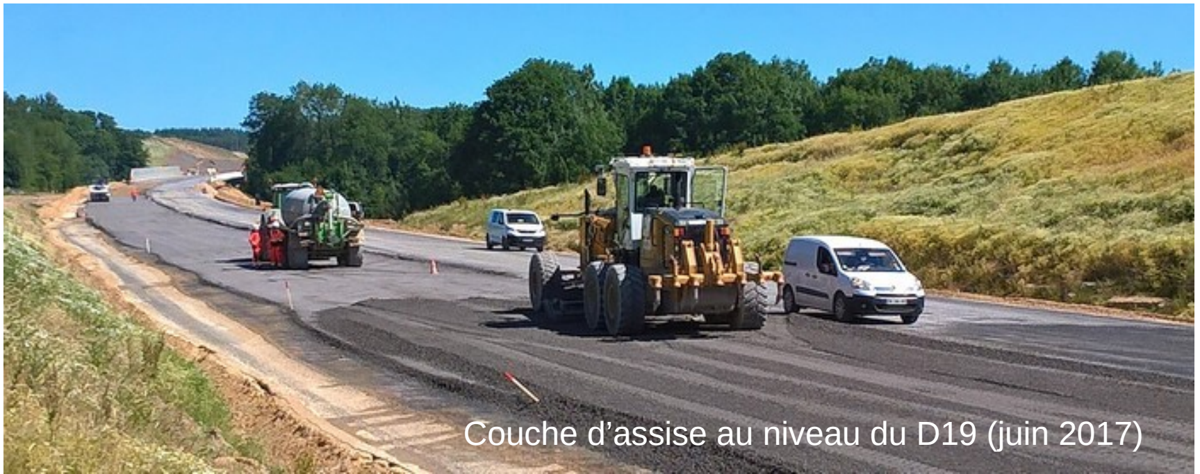
Couche d'assise au niveau du D19 (juin 2017)