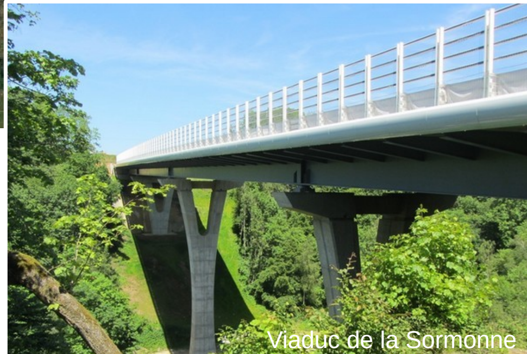
Viaduc de la Sormonne