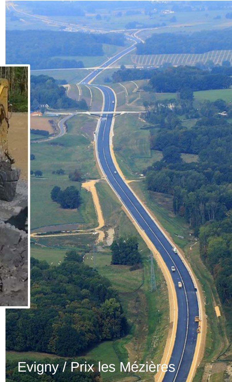
Evigny / Prix les Mézières